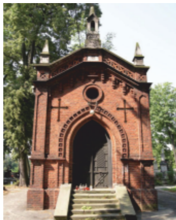
Kaplica św. Adeli - Burghardów