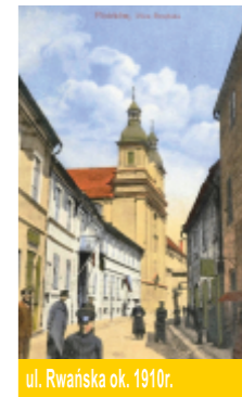
ul. Rwanańska ok. 1910r.